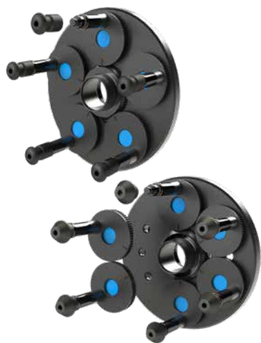
8-21100296 FPF FASTPLATE KIT

per cerchi a 3-4-5-6-8 fori. Range bloccaggio 95,25 - 180 mm