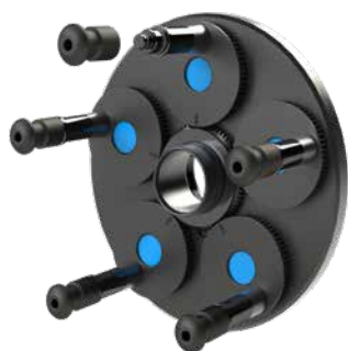
8-21100294 FPF FASTPLATE 5

per cerchi a 5 fori. Range bloccaggio 95,25 - 180 mm