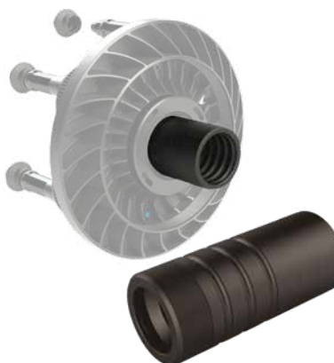
8-21100297 FPF-C SLEEVE HANDLE

Manicotto per equilibratrici a bloccaggio automatico. Si avvita direttamente alla FASTPLATE per lavorare più comodamente e velocemente