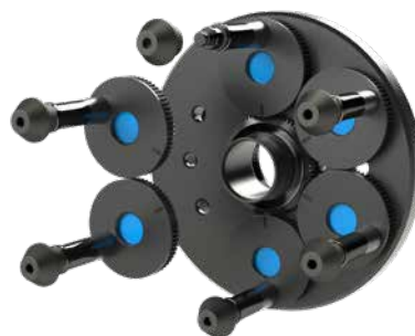
8-21100295 FPF FASTPLATE 3-4-6-8

per cerchi a 3-4-6-8 fori. Range bloccaggio 95,25 - 180 mm