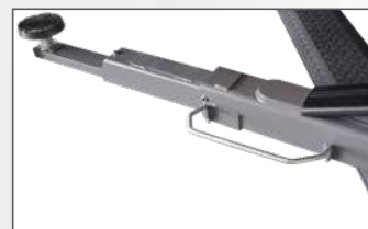
Quattro bracci asimmetrici a 3 stadi . Ultima estensione del braccio estremamente sottile (30 mm) per consentire la presa dei vicoli ribassati