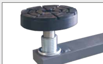
Doppia filettatura per una grande regolazione verticale del tampone (95÷180 mm)